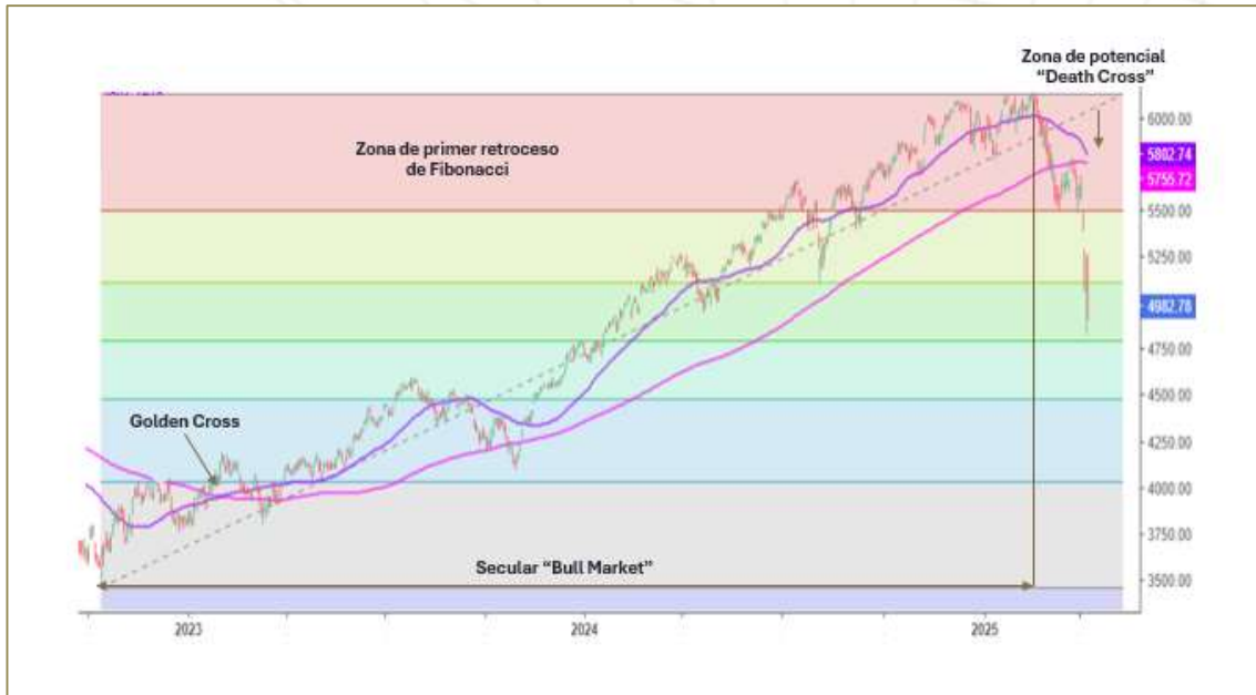
Figura n°5: S&P500 – Lectura Técnica