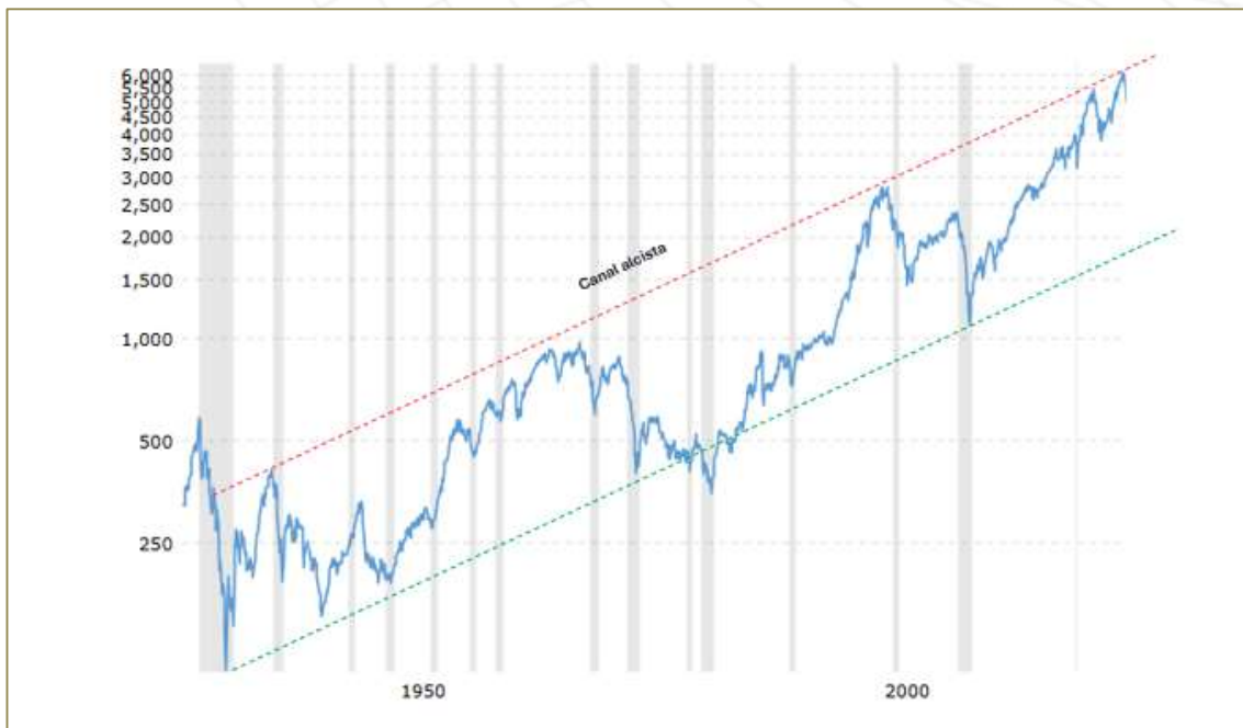
Figura n°6: S&P500 – Gráfico Histórico (corregido por IPC y escala logarítmica)