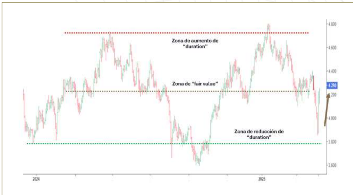
Figura n°3: Rendimiento de la tasa de 10 años del Tesoro de EE.UU. (%)

De hecho, en el corto plazo, ya sea porque el mercado considera que la Reserva Federal evitará la recesión o por los motivos técnicos que sean, como puede observarse en la figura n°3, la tasa de 10 años del Tesoro de EE.UU. lejos de profundizar su caída, ha rebotado y ha regresado a la zona de "fair value" , definida por un objetivo de largo plazo de la tasa de política monetaria de 3,0% y un spread histórico con la tasa a 10 años de 125 pbs.